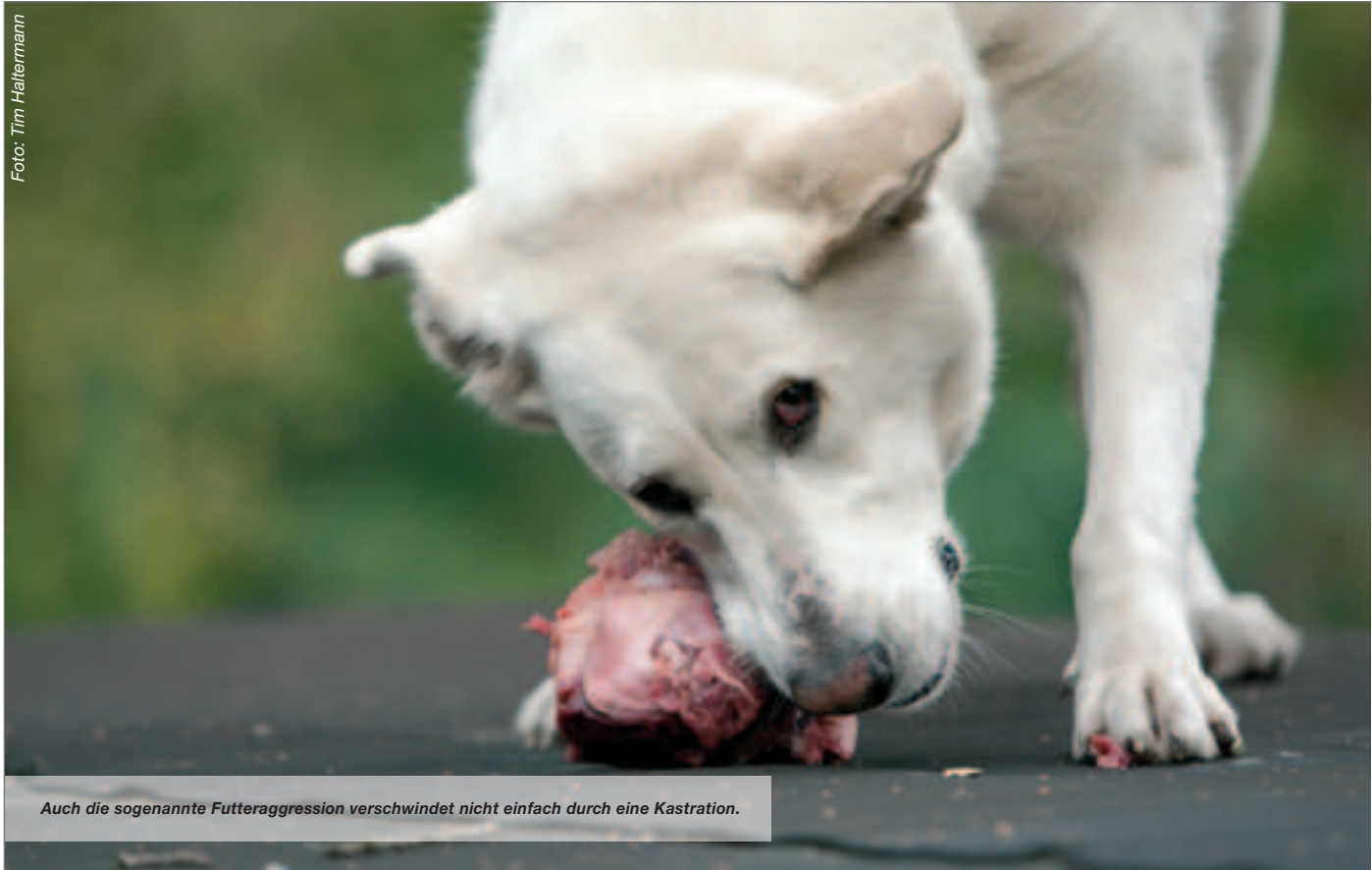
Auch die sogenannte Futteraggression verschwindet nicht einfach durch eine Kastration.

Häufig wird geschildert, dass Hündinnen kastriert werden sollen, weil die Halter/innen die wenigen Blutstropfen bei der Läufigkeit auf dem hellen Teppichboden nicht mögen. Solche und ähnliche Argumente aber können nach dem Tierschutzgesetz keinen Bestand haben.