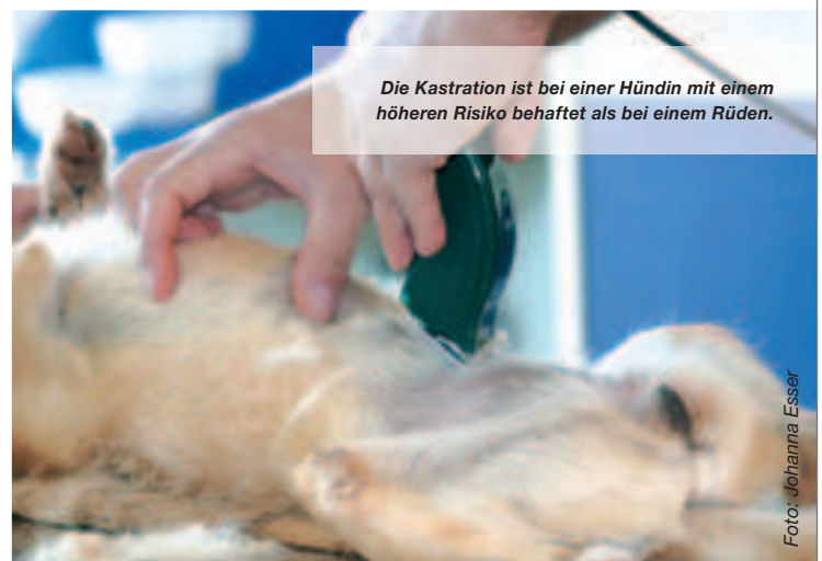
Die Kastration ist bei einer Hündin mit einem höheren Risiko behaftet als bei einem Rüden.

Was aber normalerweise nicht dazu gesagt wird, ist die Frage, wie viele Hündinnen denn überhaupt von Gesäugetumoren befallen werden. Je nachdem, welche Altersgruppe und welche Studie man